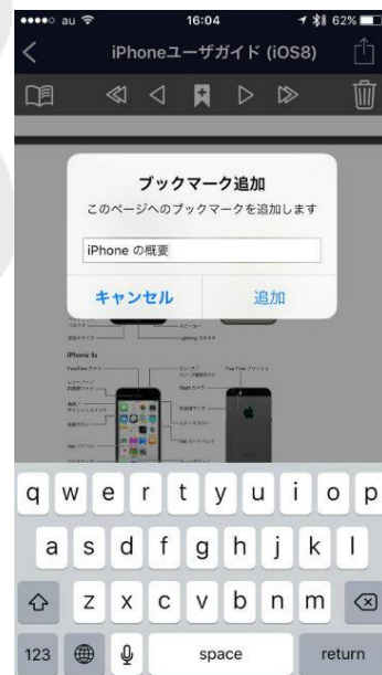
ブックマーク追加