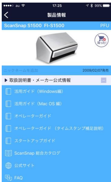
取扱説明書 メーカー公式情報