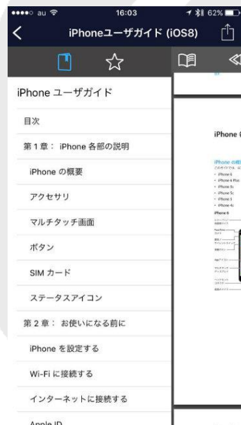
目次表示 ※対象：目次設定された説明書