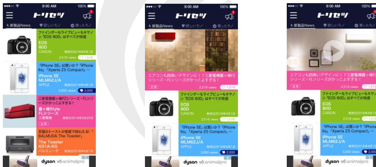
ネイティブ広告配信イメージ