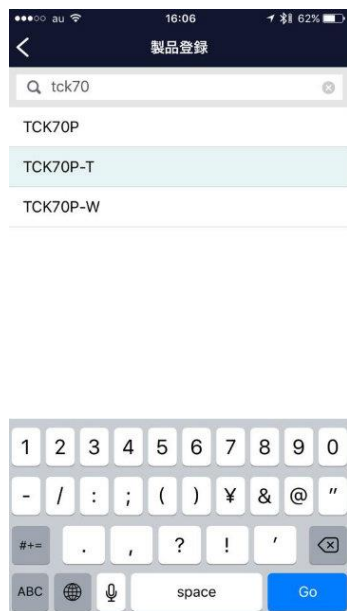
型番入力 (インクリメンタルサーチ)