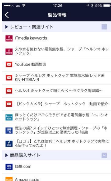
レビュー・関連サイト